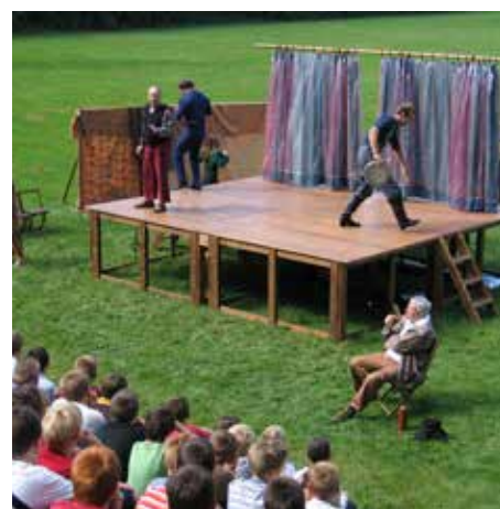
La fête interdite, par la Compagnie des Bonimateurs

Le projet de parc qui se concrétise progressivement s'inscrit dans une réflexion globale qui vise à développer le bien-être personnel, notamment par la relation à la nature.