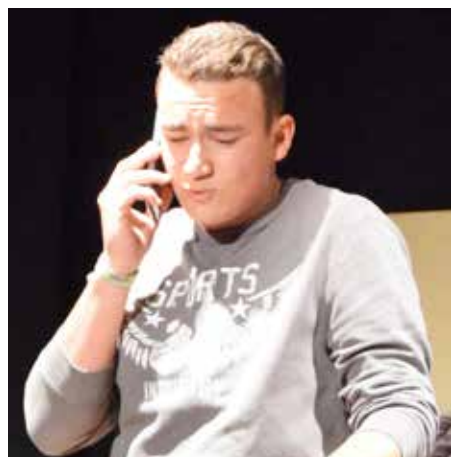
Check Please , de Jonathan Rand, pièce de théâtre jouée en anglais par les élèves du Collège