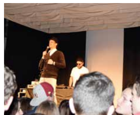
Concert de Nouvel An 2017 des rhétos