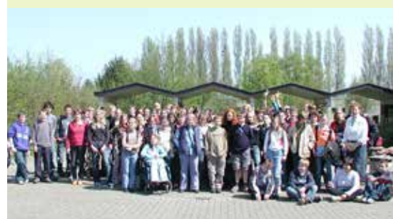
Échanges linguistiques des 5 es avec Zepperen et des 2 es avec Stekene