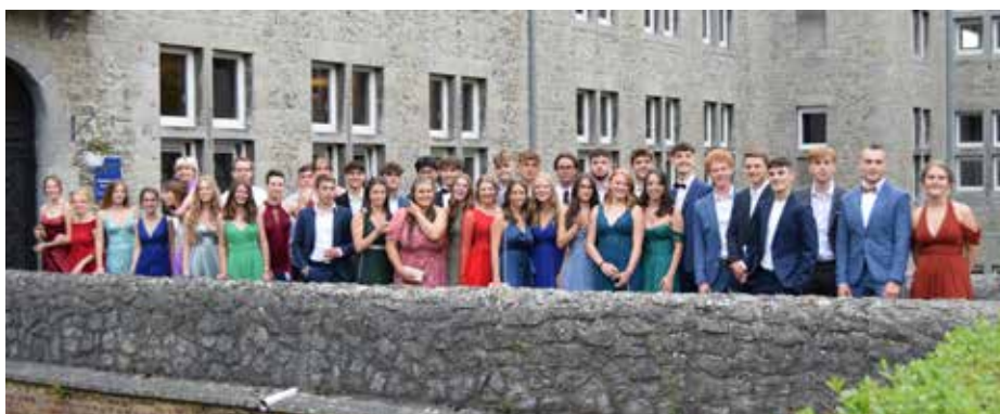
Les rhétos 2022-2023 lors de la proclamation